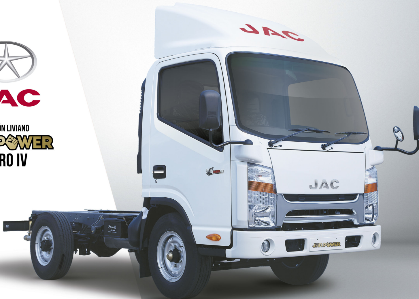
Imagen de referencia, algunas características técnicas y accesorios pueden cambiar sin previo aviso