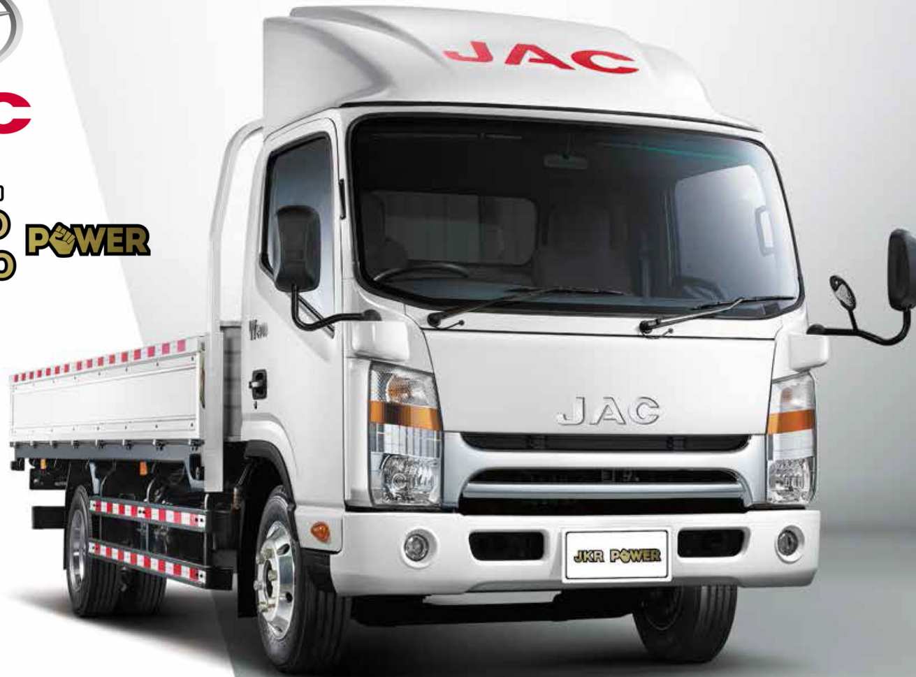
Imagen de referencia, algunas características técnicas y accesorios pueden cambiar sin previo aviso

CAMIÓN LIVIANO JKR MEDIO LARGO POWER EURO IV